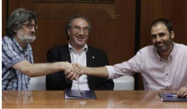
Sindicatos y Educación firman la paz y la Asamblea se queda sola

El conseller asegura que el acuerdo queda cerrado, se ratificará en mesa sectorial y no habrá más negociación