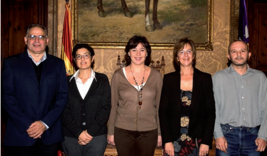
Recepció de la presidenta i la vicepresidenta del Consell de Mallorca a la presidenta, vicepresident i secretari del CEM