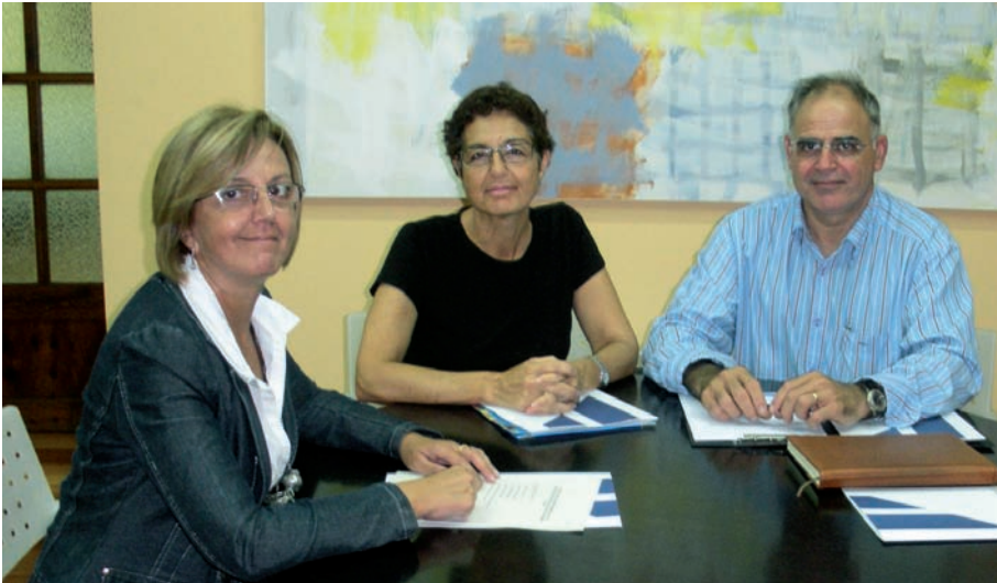
Visita de la presidenta i vicepresident del CEM a la vicepresidenta i consellera del Departament de Culutra i Patrimoni del Consell de Mallorca