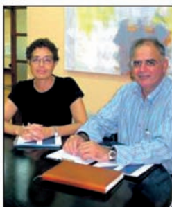
Els responsables del CEM.

El passat dimarts, 30 de setembre, es convocà el primer ple del Consell Escolar de Mallorca (CEM), durant el qual s'aprova definitivament el reglament de funcionament del nou organisme i se'n va consti-